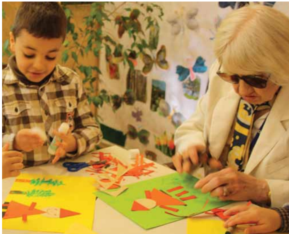
Jung und Alt trafen sich zum Basteln im AWO Seniorenwohnsitz Kennedypark

AACHEN. Zweimal im Monat treffen sie sich im großen Saal des AWO Wohnsitzes Kennedypark: Vorschulkinder der Integrativen Kindertagesstätte Elsassstraße und Bewohnerinnen der AWO Einrichtung. Das gemeinsame Singen, Spielen und Basteln ist für alle jedes Mal ein großer Spaß, willkommene Abwechslung für die einen und eine besondere Erfahrung für die anderen. Die Kinder finden es spannend, ihre betagten Nachbarn zu besuchen, und die Bewohnerinnen freuen sich über die Begeisterung, den Eifer und die Neugier ihrer kleinen Be-