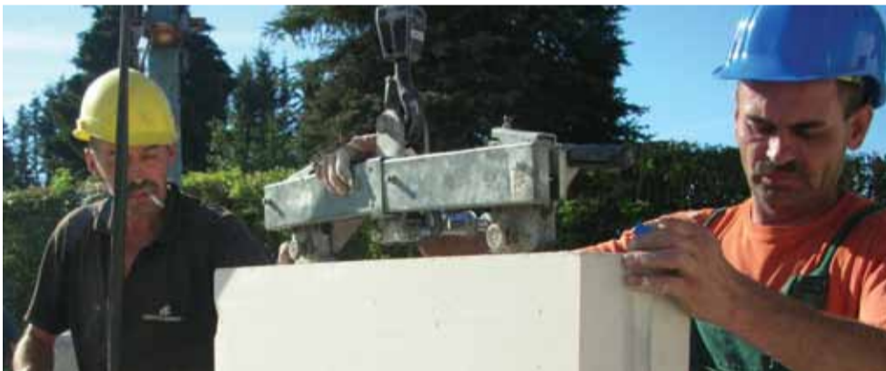
Im Frühjahr 2012 soll das neue Haus fertig sein.

ROETGEN. Die Arbeiten am Bau des neuen Zuhauses der AWO Kindertageseinrichtung Lummerland sind bereits weit fortgeschritten. Im Frühjahr soll aller Voraussicht nach der Umzug in die neuen Räumlichkeiten stattfinden, deren Bauherr die Städteregion Aachen ist. Der neue Standort auf dem Gelände eines ehemaligen Bauhofs an der