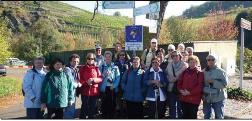
Unter dem Hinweisschild für die Partnerstadt Eurode nahm die Wandergruppe in Mayschoss Aufstellung.